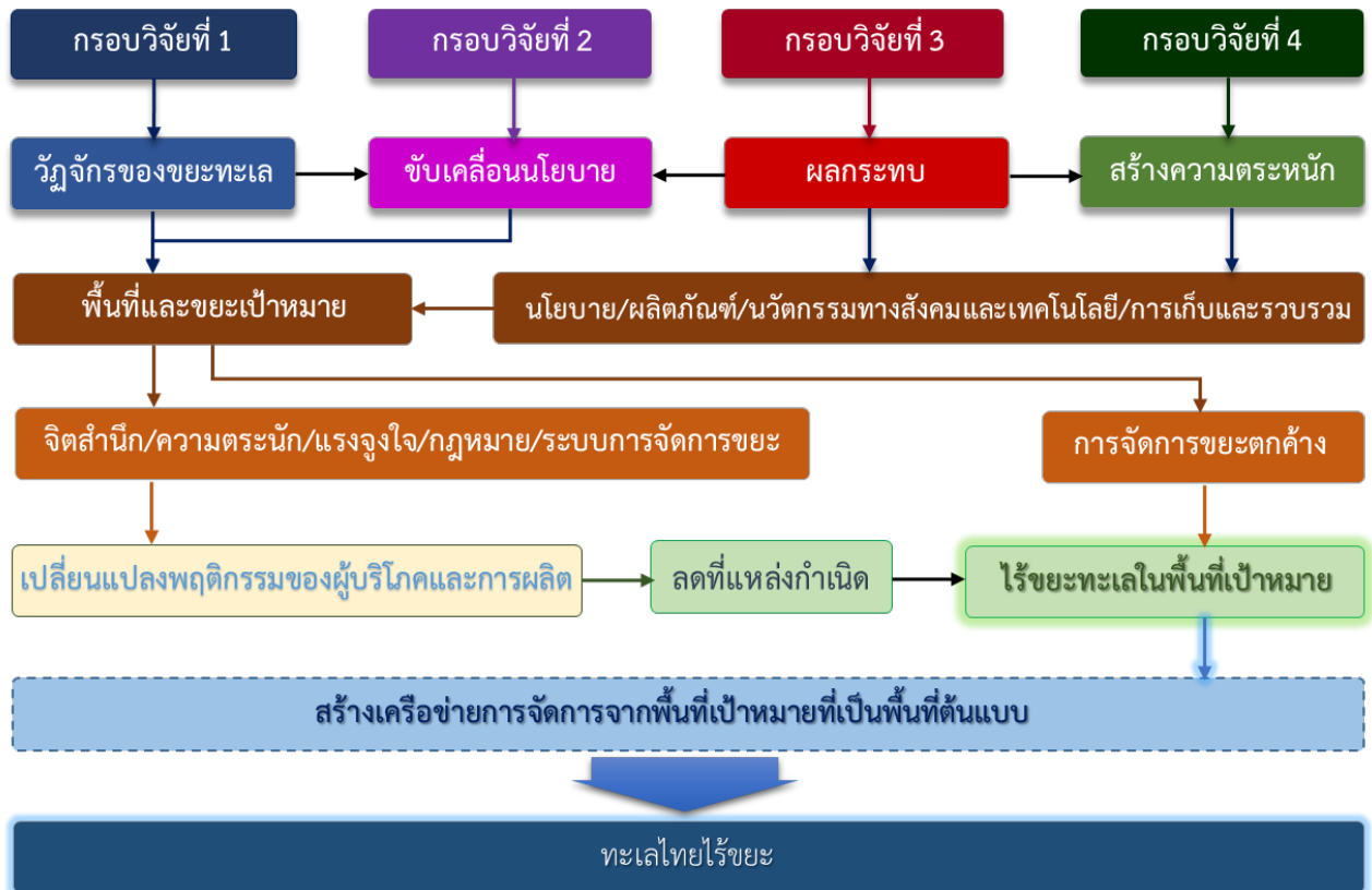
รูปที่ 2 ภาพรวมของกรอบการวิจัย

3.1 รายละเอียดงานวิจัยภายใต้กรอบการวิจัย รายละเอียดงานวิจัยภายใต้กรอบการวิจัยแต่ละกรอบการวิจัยมีดังนี้